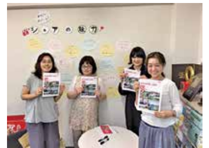
広報ボランティアのご協力により、広報誌「シェアライフ」の制作・発行・配架を行いました。