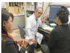
通訳を介した診療の様子

10月に、「病気になっても安心して医療を受けられない在日外国人への支援」に注力すべくクラウドファンディングに挑戦しました。その結果、161人という多くの皆様から2,205,000円ものご支援をいただきました。この時期に合わせて別途ご寄付をくださった方を含めると更に多くのご支援となりました。感謝の気持ちで一杯です。今後も、在日外国人の健康問題に真摯に向き合い一層の努力をしていきたいと思っております。