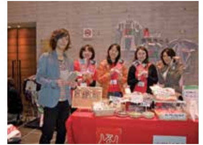
ホットジェネレーションのミュージカルは在日外国人の健康がテーマでした。会場にて出演者と共に (1 月)