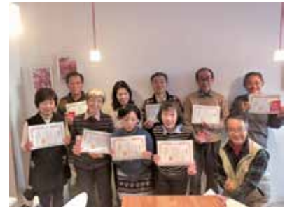
ボランティア感謝デーで感謝状を受け取った火曜（通う）ボランティア

既存の媒体であるブログ・Facebook・Twitterを合わせて情報発信を行いました。また、機関誌「ボン・パルタージュ」（年1回）、年次報告書、広報誌「シェアライフ」（年2回）、メールマガジンの発行を行いました。