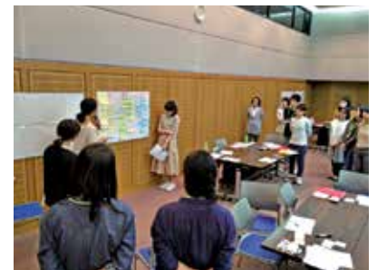
国際看護・保健を目指す人のためのキャリアナビ講座では講義とグループワーク形式の 2 部構成で行い、参加者同士の活発な話し合いがされました。(10 月)