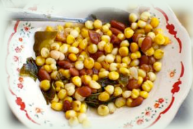
伝統料理 パタールガーデン